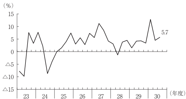
第2図 設備投資増加率（全産業）