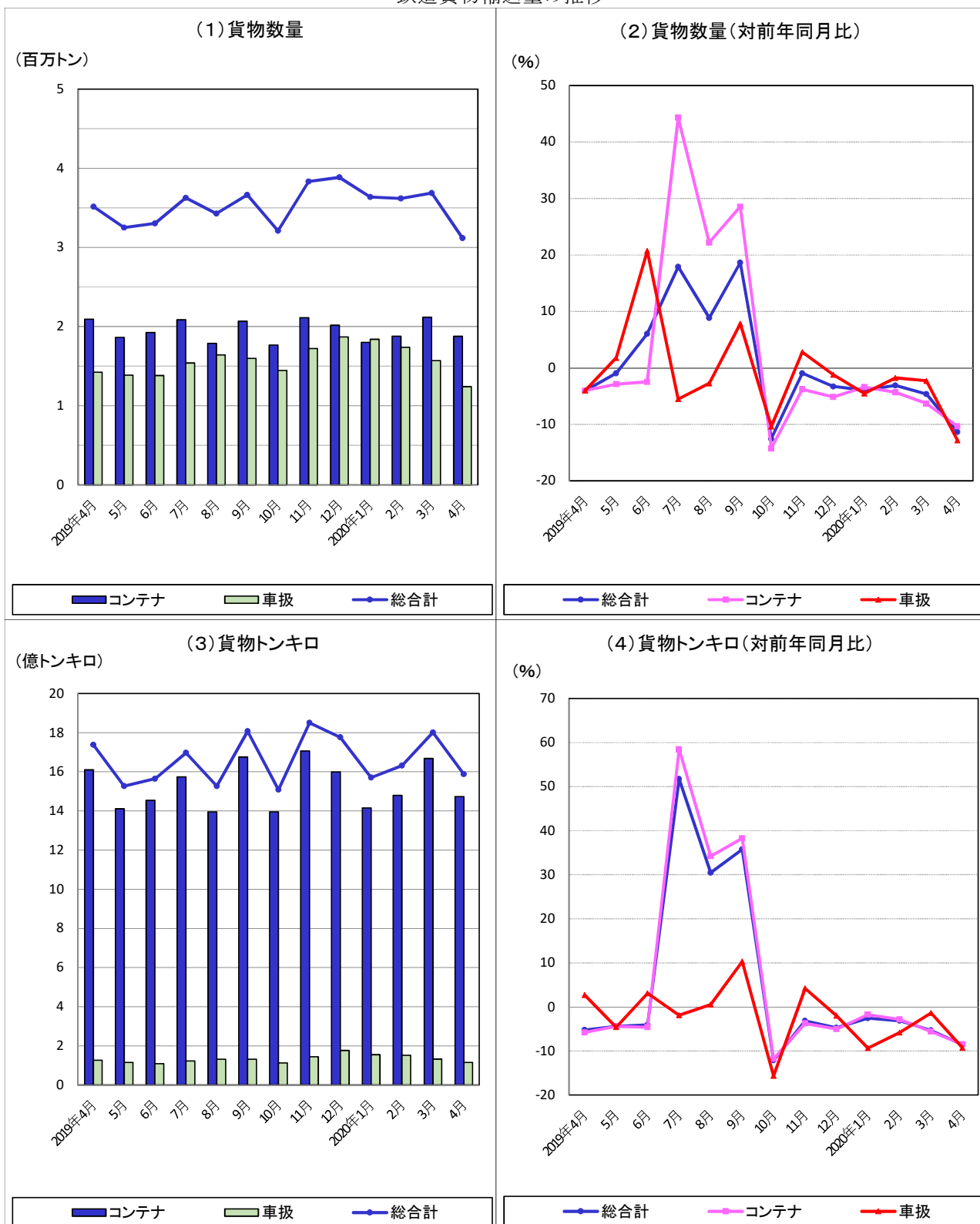
鉄道貨物輸送量の推移

本月の貨物数量総合計は、312万トン、指数86.6、前年同月比11.3%減、貨物トンキロ総合計では、16億トンキロ、指数88.6、前年同月比8.6%減であった。また、これらの月別、業態別推移は下図のとおりである。