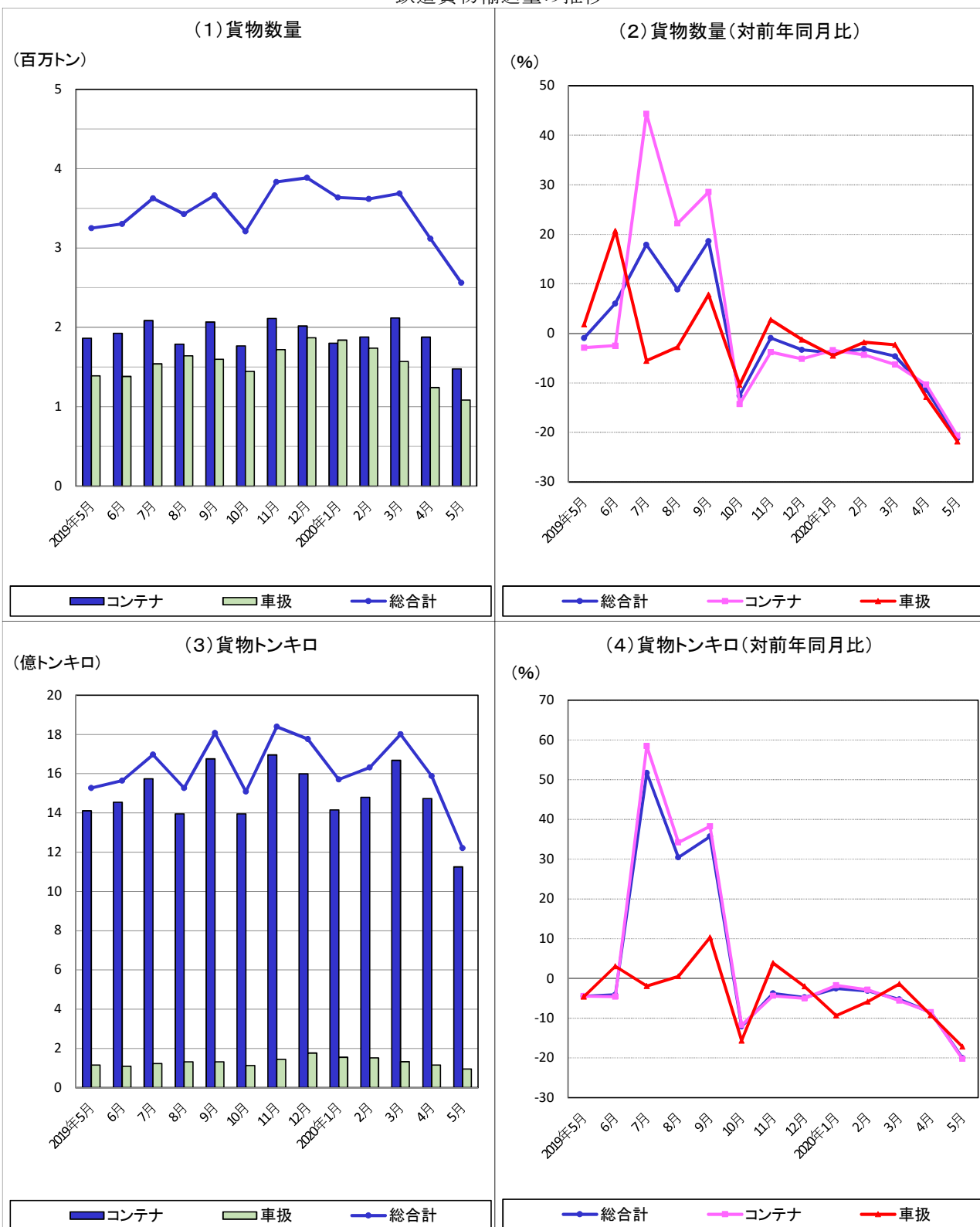
鉄道貨物輸送量の推移

本月の貨物数量総合計は、256万トン、指数71.2、前年同月比21.1%減、貨物トンキロ総合計では、12億トンキロ、指数68.1、前年同月比20.0%減であった。また、これらの月別、業態別推移は下図のとおりである。