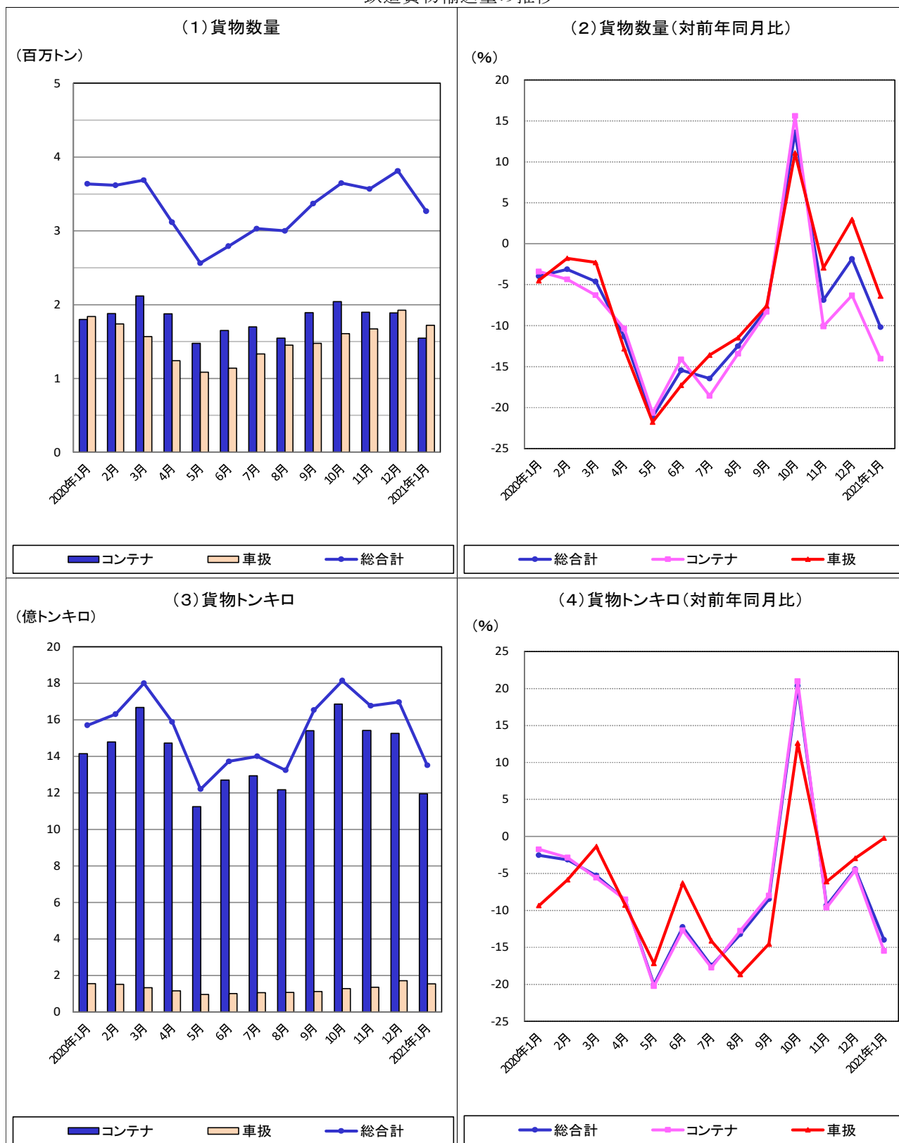
鉄道貨物輸送量の推移

本月の貨物数量総合計は、327万トン、指数90.8、前年同月比10.2%減、貨物トンキロ総合計では、14億トンキロ、指数75.3、前年同月比14.0%減であった。また、これらの月別、業態別推移は下図のとおりである。