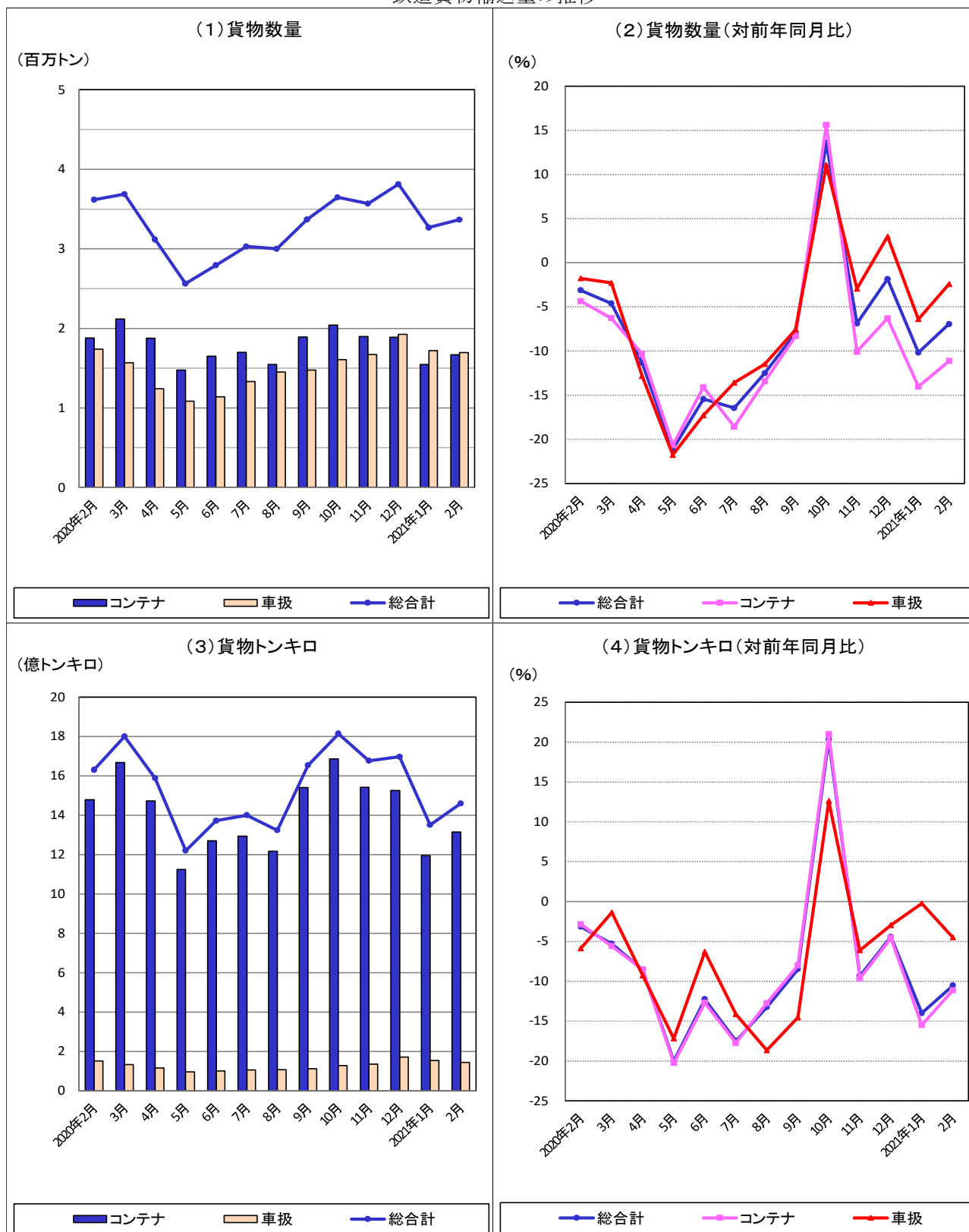
鉄道貨物輸送量の推移

本月の貨物数量総合計は、337万トン、指数93.5、前年同月比6.9%減、貨物トンキロ総合計では、15億トンキロ、指数81.4、前年同月比10.5%減であった。また、これらの月別、業態別推移は下図のとおりである。